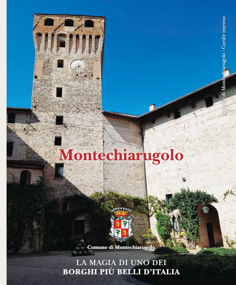
Castello di Montechiarugolo - Cortile interno

Da Reggio Emilia raggiungere stazione ferroviaria di Parma, Autobus TEP Linea 11 destinazione Montecchio Emilia - fermata Montechiarugolo chiesa.